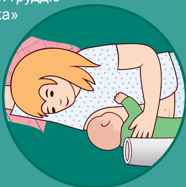
Поза для годування груддю в положенні лежачи