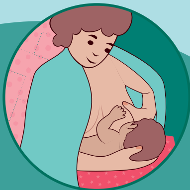
Модифікована поза для годування груддю «колиска»