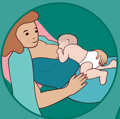
Поза для годування груддю, спираючись на спину